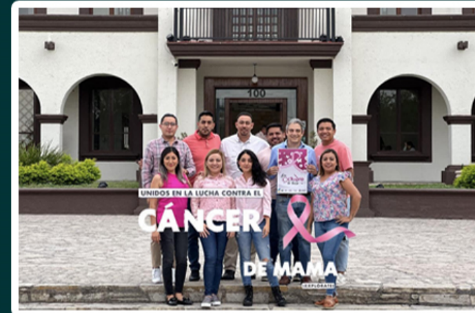
EL GOBIERNO MUNICIPAL DE #ESCOBEDO SE UNE PARA APOYAR LA CAUSA HAGAMOS CONCIERTIZACIÓN SOBRE EL CÁNCER DE MAMA