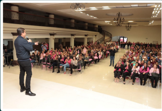
TRABAJAN EN JUÁREZ EN LUCHA CONTRA EL CÁNCER